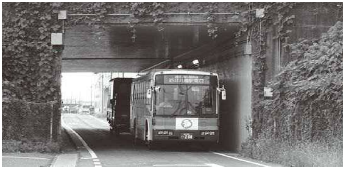
危険な名神高速道路下の通学路

問 交通量の独自調査の結果、県道土山蒲生近江八幡線の上羽田町平石付近で、5時から19時は3696台、内1時間あたりは7時から8時の最大量は7時から8時で664台であった。