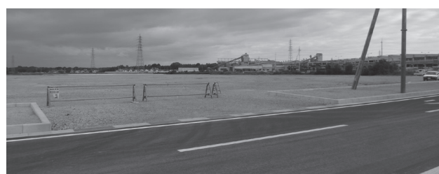
新たな雇用が生まれる企業の進出が決定

問 手引きでは、議会議決は要件となっていないが、議会審議と議決が望ましいのでは。