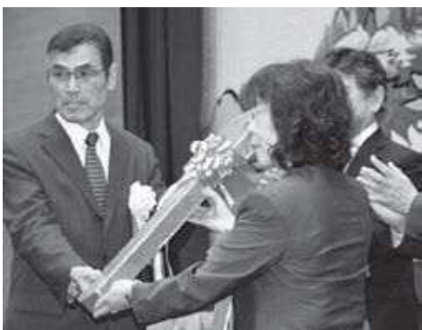
14コミセン最後の指定管理開始式

の移行前と同様に、コミセンは社会教育法による公民館の役割と、住民主体によるまちづくり活動の推進の役割を果たしています。 まち協が指定管理者となったことで、地域にとっても、より利用しやすい施設となってきたものと考えています。