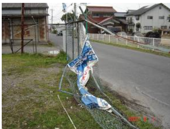
発生した交通事故現場