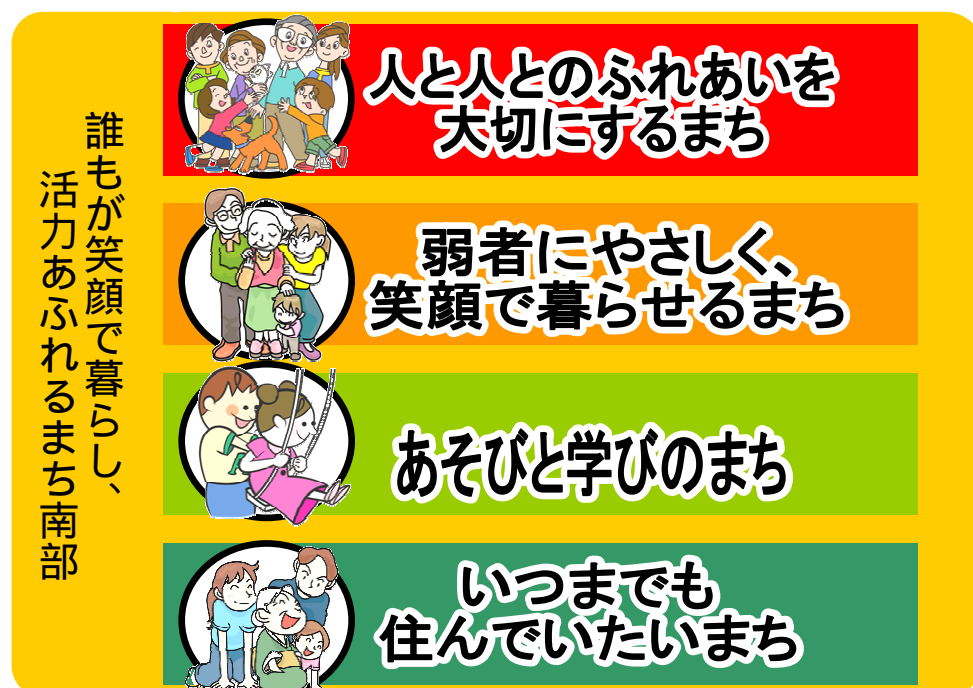
まちづくりの基本方針イメージ