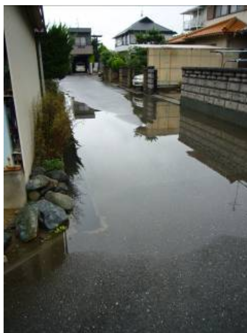
一時的に冠水した道路