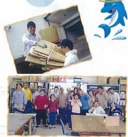
（ブルーメの丘・手織りの館）

働く目的を考えたり、生活力を付けるために地域での準仕活動や調理実習も実施しています。