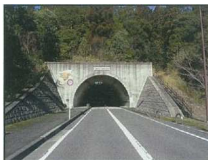
きぬがさ山トンネル

建設年次別では、1990年代に建設されたトンネルが2本あり、20年以上経過している。