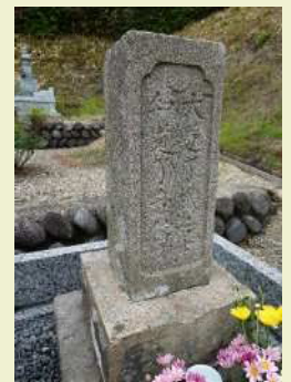
十六花卉の菊の 紋が刻まれた墓

*蛭谷筒井公文所が1843（天保14）年に発行した往来手形や蛭谷帰雲庵が1847（弘化4）年に発行した宗門手形等