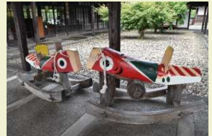
大きいサイズのきじ馬

きじ馬・きじ車は桐や朴の木の本体に、輪切りにした松の木の車輪をつけたもので、椿の赤い花などが描かれる華やかな玩具です。2輪のものはきじ馬、4輪ものはきじ車と呼ばれることが多いようです。現在は小ぶりの置物が多くなっていますが、かつては子供が引っ張ったり、乗ったりして遊ぶことができるような大きなものでした。