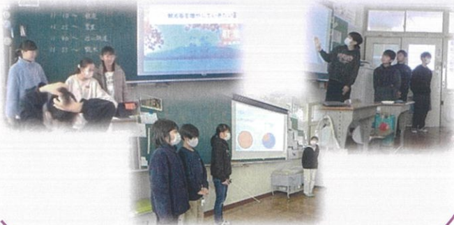
【蒲生地区まちづくり協議会】

発表内容では、近江鉄道利用促進、豊かな歴史遺産、より良いまちづくり、地産地消、空き家対策、農業改善など、蒲生の特性を活かしたアイデアが次々と提案されました。この発表会の素晴らしいアイデアを参考にさせてもらい、将来のまちづくりに繋がっていきたいと考えています。