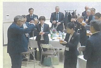
【蒲生地区まちづくり協議会】

その後は、蒲生産の米・小豆で作った赤飯やミニトマト、応援塾のこだわりコーヒーなどで和やかに一年の計を語りました。