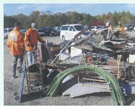
【蒲生地区まちづくり協議会】