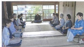
【一般社団法人がもう夢工房】