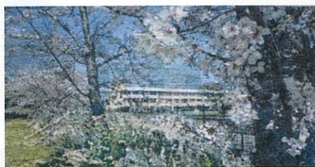
圧巻のモザイクアート作品