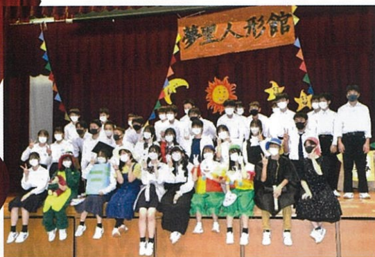
センターは校長先生?!

令和3年度の愛東中学校文化祭が9月17日(金)に開催されました。2週間余りの期間でセリフを覚えたり、劇の練習や道具を作ったり、各学年が一丸となって創りあげ、どの学年も大変素晴らしい劇でした。