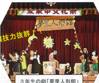
3年生の劇「夢聖人形館」