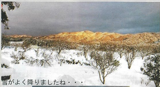
雪がよく降りましたね・・・