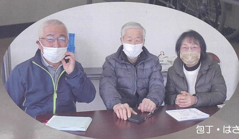
包丁・はさみ・おもちゃの再生病院