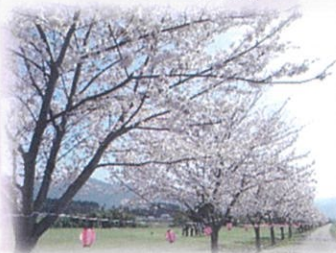
愛知川河川敷広場の桜