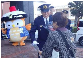
▲西友八日市店での啓発活動

出動式では、署長のあいさつ、来賓のあいさつ、服装点検が行われ、その後、滋賀学園高等学校ジャズオーケストラ部の演奏に見送られ、一斉に管内のパトロールに出動しました。