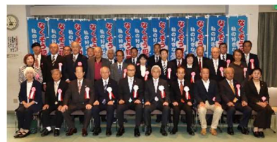
▲滋賀県警察本部長・滋賀県防犯協会会長連名表彰を受賞されたみなさん