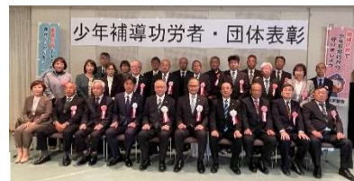
少年補導功労者・団体表彰を受賞されたみなさん▶