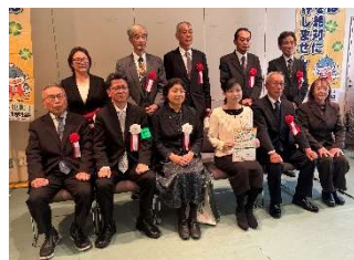
▲「なくそう犯罪」滋賀安全なまちづくり大賞を受賞されたみなさん