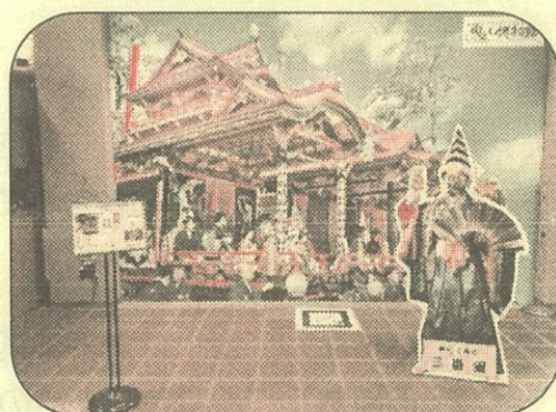
長浜市曳山博物館