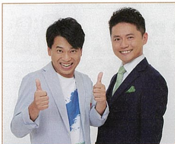
ファミリーレストラン