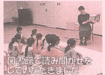
図書館で読み聞かせをしていただきました