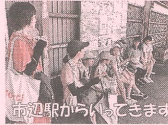
市辺駅からいってきます

市辺駅→八日市駅→八日市図書館→アピアの旅。 4班に分かれて真夏の電車旅をしました。 アピアではお小遣いで買い物したり鉄道ミュージアムを見学したりと、ワクワクがたくさん詰まった旅でした。