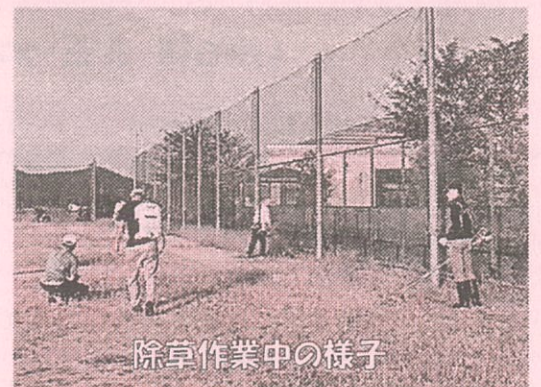
除草作業中の様子

8月23日、自治会連合会の皆様で市辺グラウンドの草刈りと除草剤散布作業をしていただきました。早朝から強い日差しが降り注ぐ暑い日でしたが、手早くきれいにしていただきました。ありがとうございました。