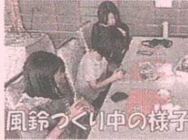
風鈴づくり中の様子