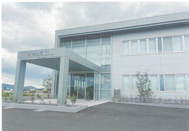
▲向茂組新本社 今崎町