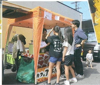
【キッチンカー(カレー)】