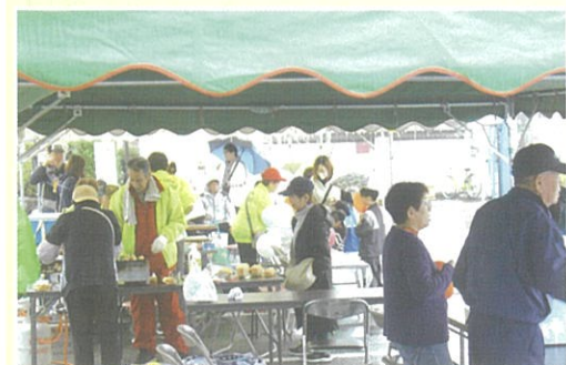
【雨の中たこ焼き作り】

さんによる大人と子どものよさこい踊り。室内ステージでは、キャサリンバンドさんによる懐かしの名曲を演奏してもらいました。