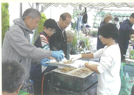
【焼き鳥のお手伝い】