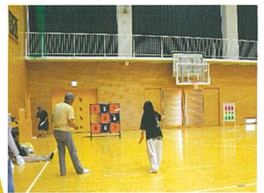
【ストラックアウト】