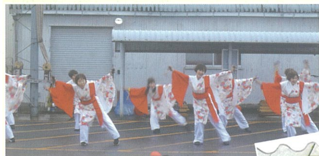
【オープニングのよさこい】