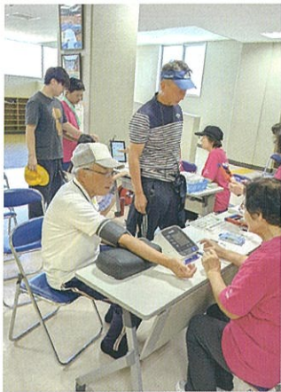
【健康診断 血圧測定】