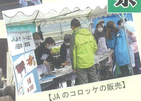
【JAのコロッケの販売】

今年の文化祭はあいにくの雨でしたが、たくさんのお客様に来場頂き、バザーもほぼ完売しました。オープニングは、伴ダンスサークル