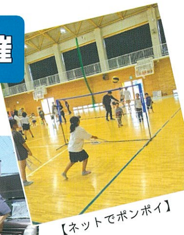
【ネットでポンポイ】