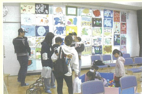
【館内展示 力作ぞろい】