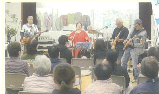
【ステージではキャサリンバンド】