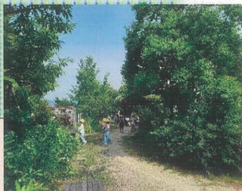
夏の子ども森「何の木かな・・・」

子ども森は、八日市南小学校の新築移転とともに設置されました。まちづくり協議会では、毎月第2水曜日に子ども森の整備作業をして、森の維持をしています。整備された子ども森は、子どもたちの学習や秋の焼きもの会場になります。