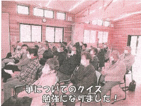
箏についてのクイズ 勉強になりました！