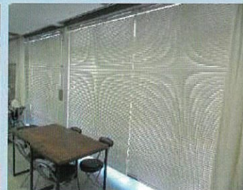
小会議室とロビーのブラインド