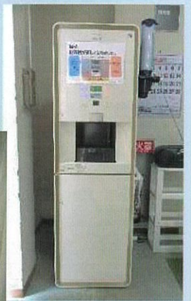
冷えたお茶と冷水が出ます。 (南部地区自治会連合会)