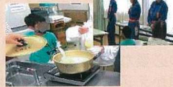
2回 防災ワークショップ