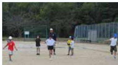
【蒲生地区スポーツ協会】