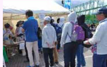
がもう夢工房（コガモカフェ）

1回目も、2回目もおおよそ30分で終了となり、皆様に「おいしかった」と好評を得ました。