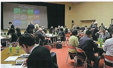
【蒲生地区まちづくり協議会】

当まち協においても、持続可能なものとするため知恵を絞って取り組んでいきたいと思えます。