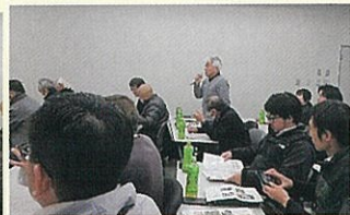
【蒲生地区まちづくり協議会】