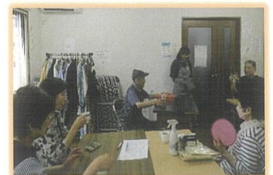
みんなのかふえの様子