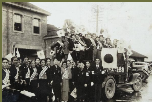
県庁前にて戦地へ向かう女性たちと見送る人々

滋賀県平和祈念館では、戦時に救護・看護要員として従軍した滋賀県出身の女性たちの体験談を中心に、戦時下の看護について展示をされています。 ぜひ、お立ち寄りください。