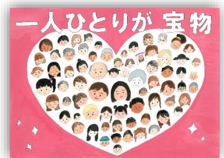
2024 最優秀作品(中学生の部)