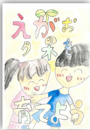
2024 最優秀作品 (小学生低学年の部)