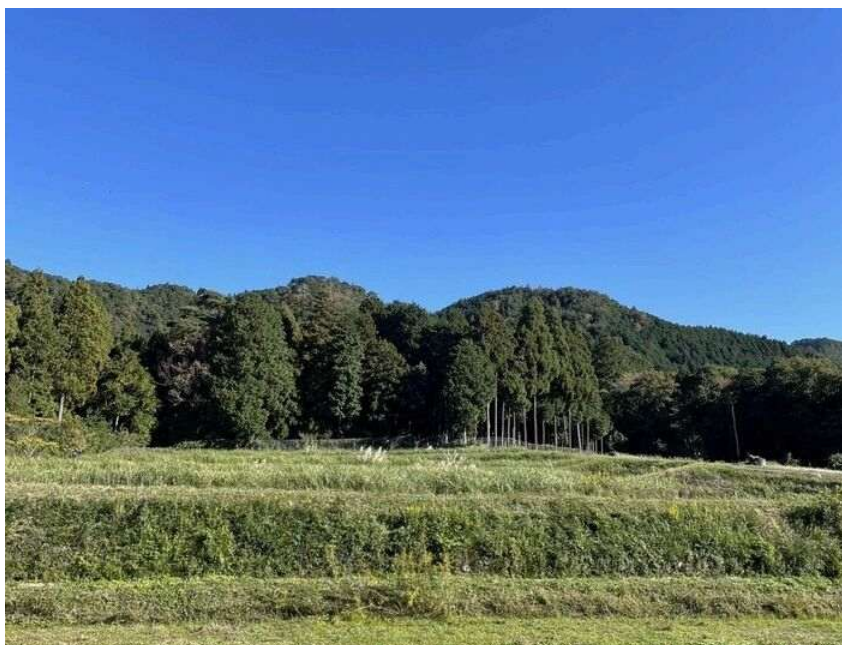
自然共生サイトとして認定された「上山町神明ともいきの里山」