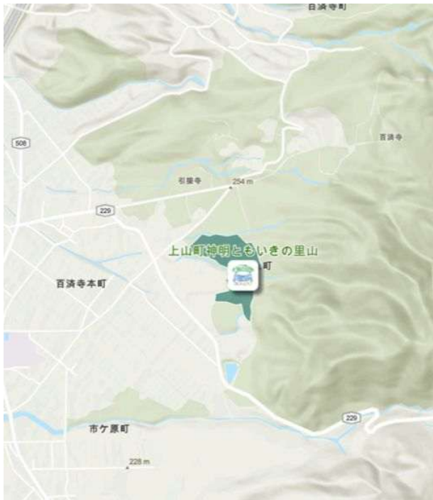
上山町神明の里山（環境省 生物多様性「見える化」マップから引用）