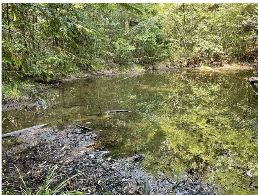
上山町神明ともいきの里山内にあるため池(1)