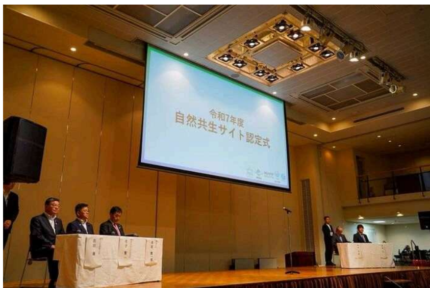
令和7年度 自然共生サイト認定式の様子