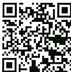
【自転車ポータルサイト】