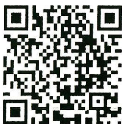
【自転車ルールブック】