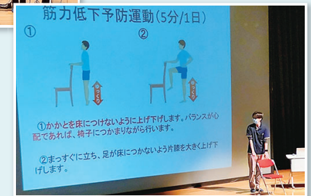
介護予防体操実演