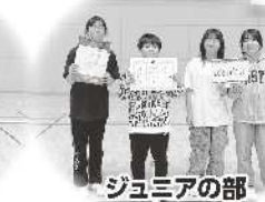
ジュニアの部 Le' a Le' a Jr.