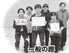
一般の部 BGU White