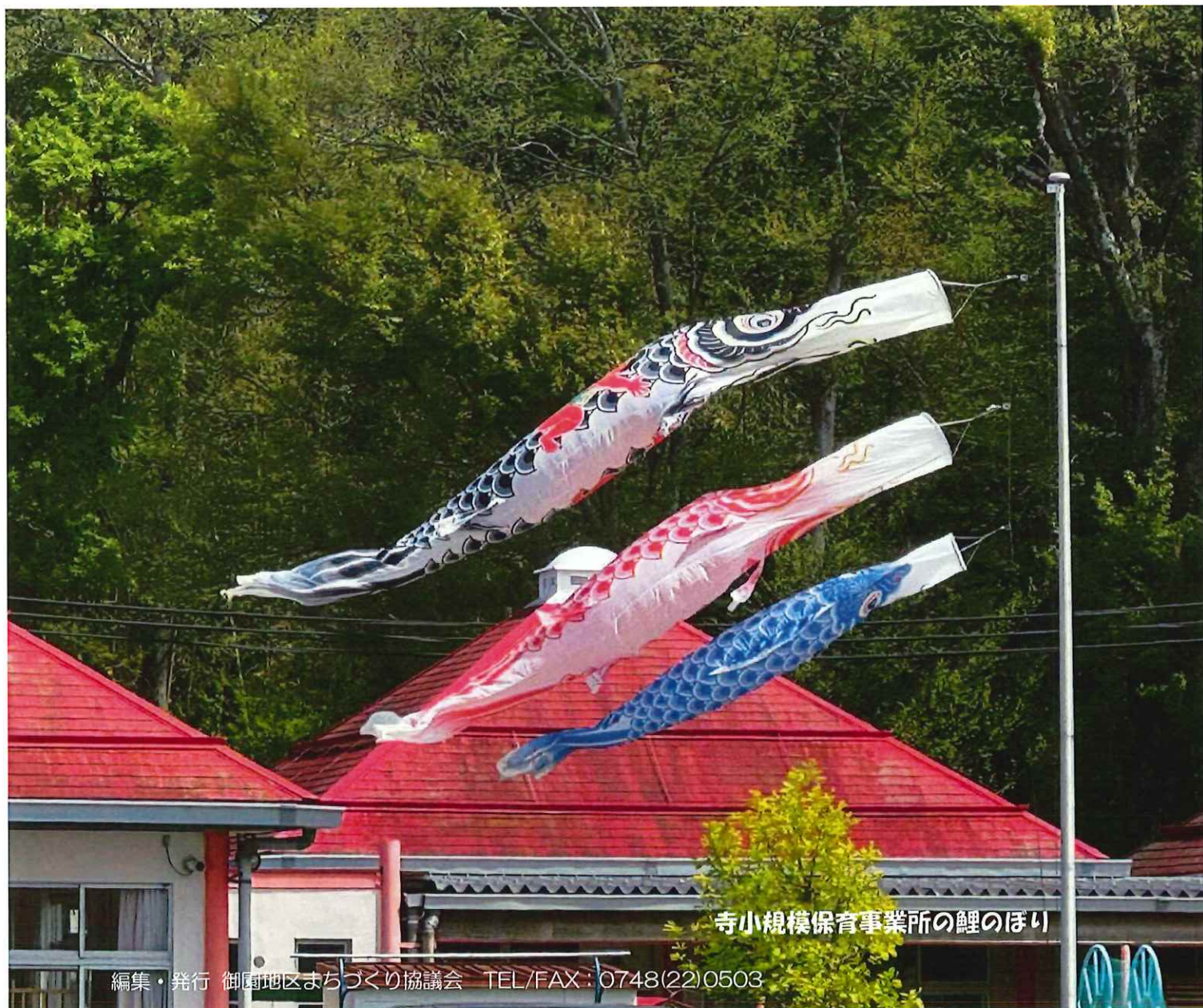
寺小規模保育事業所の鯉のぼり