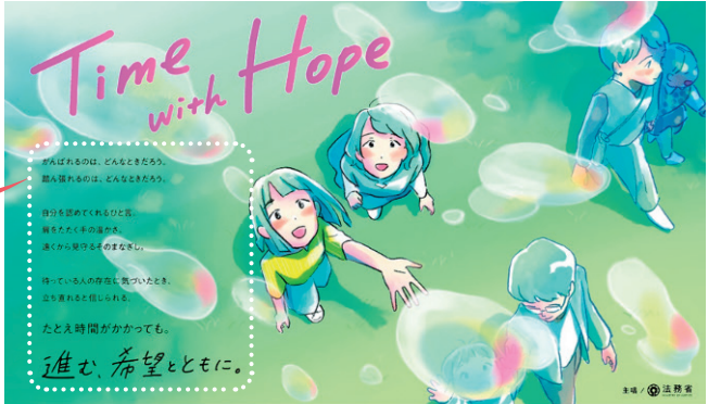
犯罪や非行を防止し、立ち直りを支える地域のチカラ 第75回 社会を明るくする運動

がんばれるのは、どんなときだろう。 踏ん張れるのは、どんなときだろう。 自分を認めてくれるひと言。 肩をたたく手の温かさ。 遠くから見守るそのまなざし。 待っている人の存在に気づいたとき、 立ち直れると信じられる。 たとえ時間がかかっても。 進む、希望とともに。