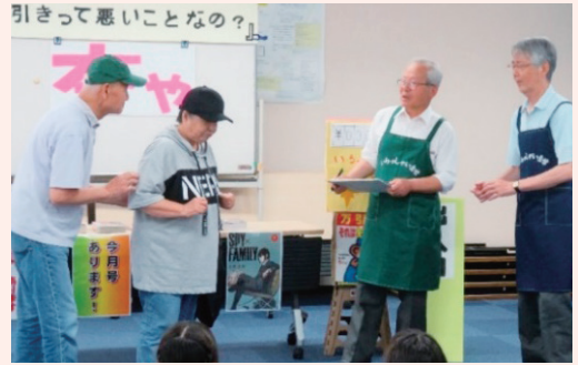
万引き防止教室啓発劇

しかしながら、活動できる人員が年々減少しているため、現在、広く会員を募集しています。市民の皆様におかれても、趣旨に賛同し、御協力いただける方、関心をお持ちの方は、ぜひ少年センターまで御連絡ください。お待ちしております。