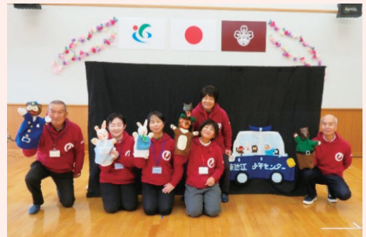
誘拐防止教室人形劇