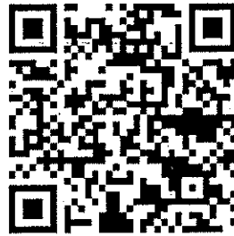
【自転車ポータルサイト】