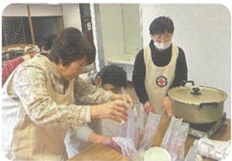
班長による炊飯訓練

今回は、ハイゼックスという特殊な袋（災害が起きた際、衛生的にお米を煮て、配れる）を使って、洗ったお米と水を入れて、カセットコンロで30分ゆでました。