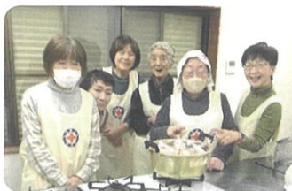
平柳班による炊飯訓練