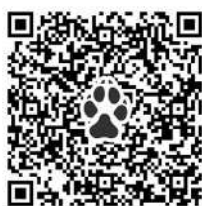
犬の死亡届 電子申請用QR