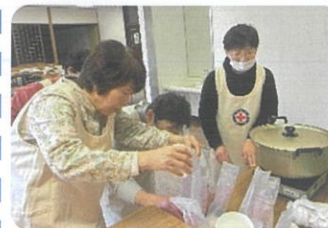
班長による炊飯訓練

今回は、ハイゼックスという特殊な袋(災害が起きた際、衛生的にお米を煮て、配れる)を使って、洗ったお米と水を入れて、カセットコンロで30分ゆでました。できあがったご飯は、とてもおいしくて、大好評でした。