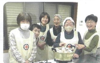
平柳班による炊飯訓練

湖東赤十字奉仕団では、団員を募集しています。個人でも入れますのでご検討ください。