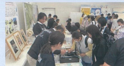
【蒲生地区まちづくり協議会】