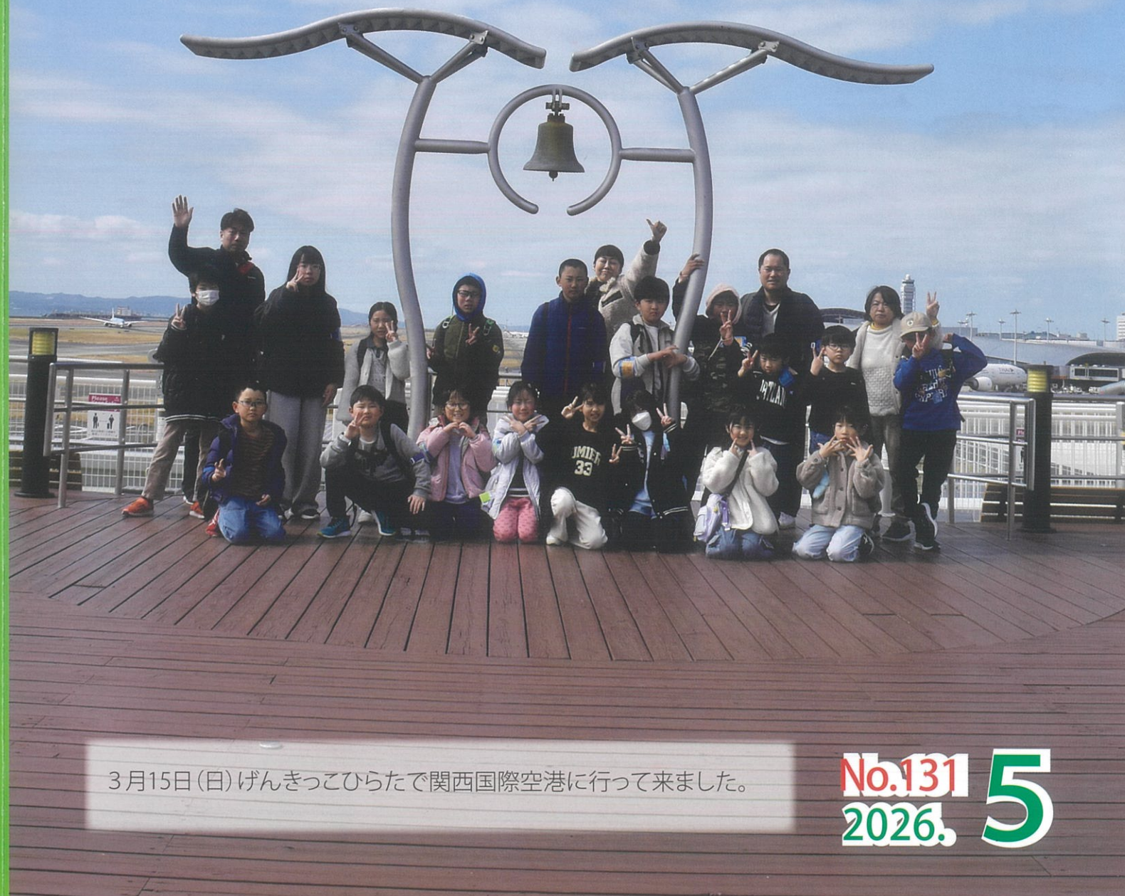
3月15日(日)げんきっぴらたで関西国際空港に行ってきました。