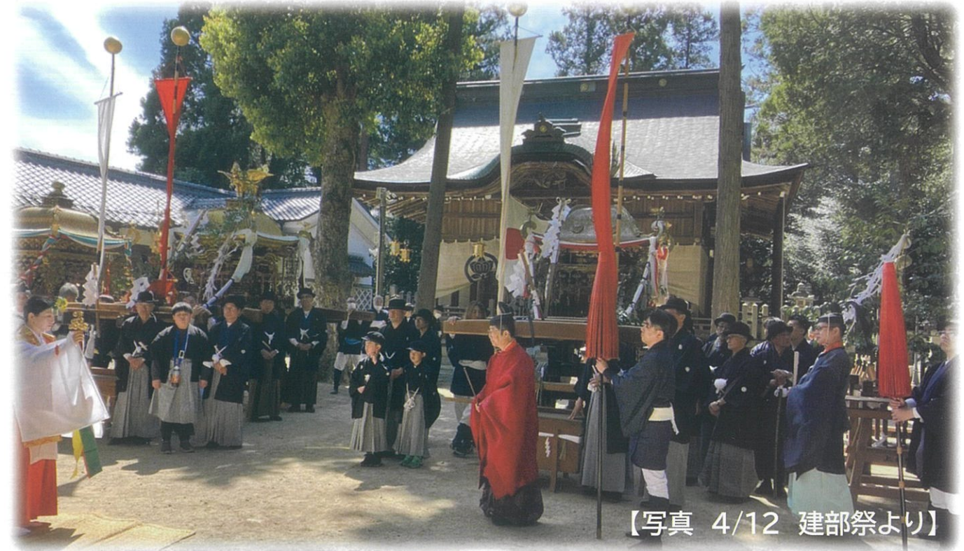
【写真 4/12 建部祭より】