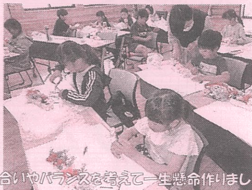
色合いやバランスを考えて一生懸命作りました

仕上げに家族への感謝の気持ちをメッセージカードに書きました。心のこもった世界で1つだけのアレンジメントフラワーが完成しました。