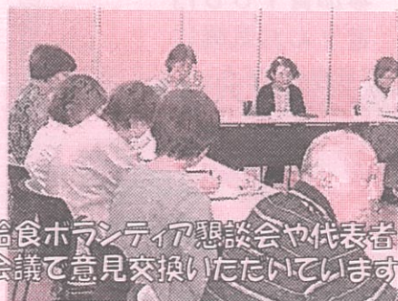
給食ボランティア懇談会や代表者会議で意見交換いただいております。