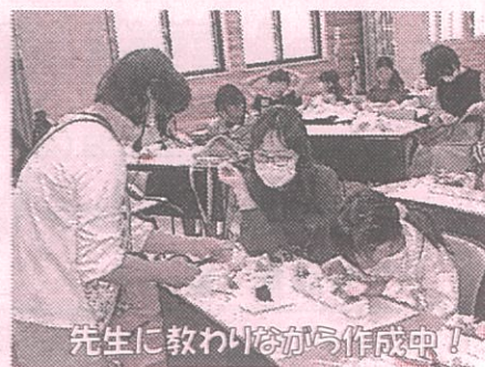
先生に教わりながら作成中!