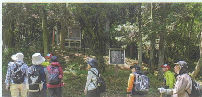
「岩船」の説明を聞く参加者