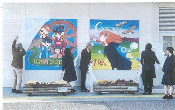
除 幕 式