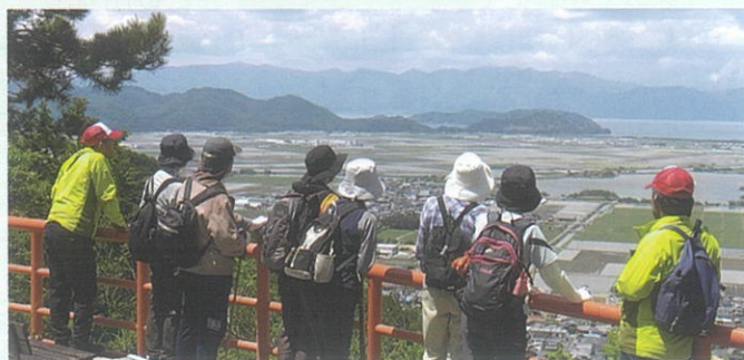
北向岩屋十一面観音堂前からの眺望