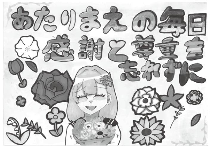
ポスター 小学生高学年の部最優秀賞

人が人らしく生きていくために、相手の立場などを思いやる人権感覚が不可欠です。お互いの人権が尊重される住みよいまちづくりの実現のために「人権のまちづくり講座」を開催します。ぜひ御参加ください。