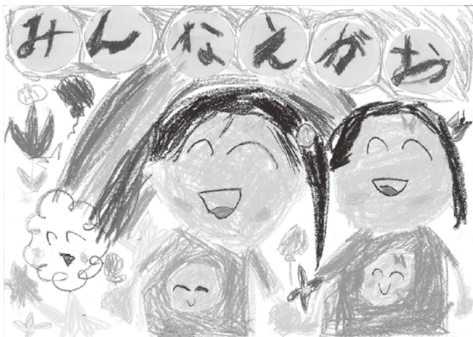
ポスター 小学生低学年の部最優秀賞