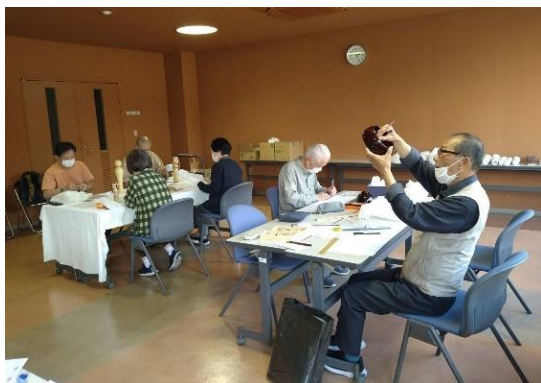
調査を進めるボランティアスタッフ

ボランティアスタッフ(10名程)の協力を得て行っています。市立能登川博物館に収蔵されている約1,200点の収蔵品の調査が4年前から始まり、約900点(R3.2時点)の調査を終えることができました。