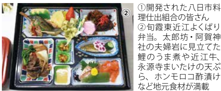
①開発された八日市料理仕出組合の皆さん ②旬霞東近江よくばり弁当。太郎坊・阿賀神社の夫婦岩に見立てた鯉のうま煮や近江牛、永源寺まいたけの天ぷら、ホンモロコ酢漬けなど地元食材が満載