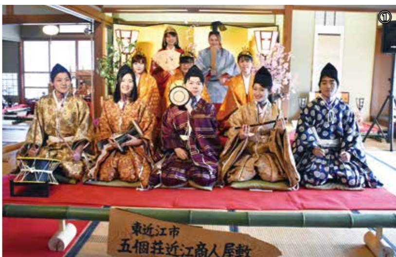
① 関連イベントとして、

近江商人屋敷4館、観峰館、八年庵、金堂まちなみ保存交流館、近江商人博物館、Cafe & Gallery Hakko Museumで「商家に伝わるひな人形めぐり」が開催され、江戸時代から現代までの約100組のひな人形を各施設に展示しました。