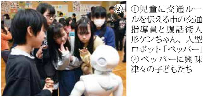
①児童に交通ルールを伝える市の交通指導員と腹話術人形ケンちゃん、人型ロボット「ペッパー」 ②ペッパーに興味津々の子どもたち