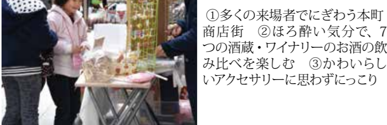
①多くの来場者でにぎわう本町商店街 ②ほろ酔い気分で、7つの酒蔵・ワイナリーのお酒の飲み比べを楽しむ ③かわいらしいアクセサリーに思わずにっこり