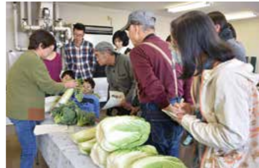
新鮮な野菜の見分け方など、メモを取り熱心に聞く参加者

参加者は魚や野菜、果物の新鮮な食材の選び方を、市場で働くプロの皆さんから教えてもらい、目の前でさばかれた天然鯛と養殖鯛のほか5種類のイチゴを食べ比べるなど、新鮮な市場の食材も堪能しました。