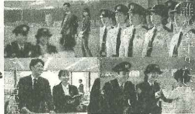
滋賀県警察官募集

◆お問合せ：滋賀県警察本部 警務課採用係 電話番号 077-522-1231(代表)