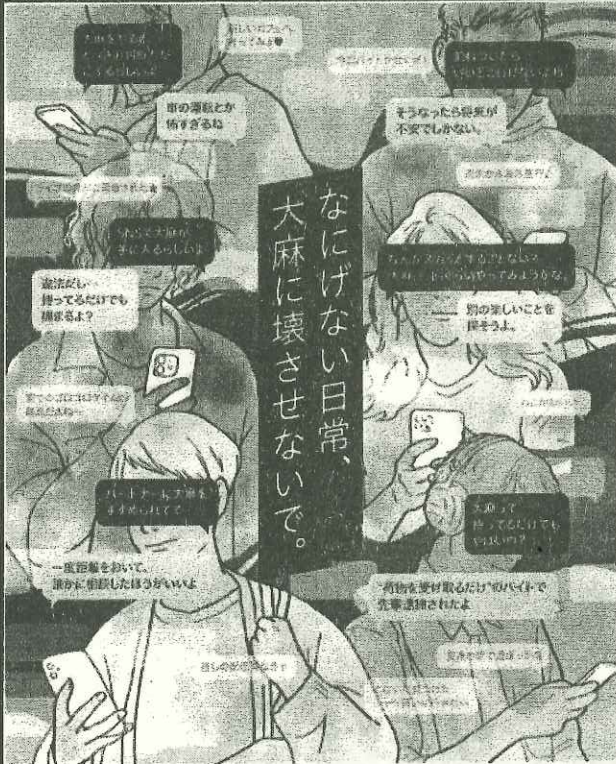
大麻は有害です。大麻の所持は違法です。誘いには乗らない。

県内における令和五年中の薬物事犯検挙人員は七六人で、大麻事犯検挙人員が覚醒剤事犯検挙人員を上回りました。