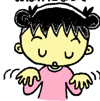
⑥5ぽんと5ぽんで おばけになって