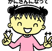
③2ぽんと2ぽんで かにさんになって