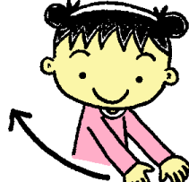
⑦おそらにとんでっ た