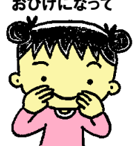
④3ぽんと3ぽんで おひげになって