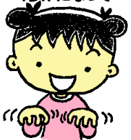
⑤4ぽんと4ぽんで くらげになって