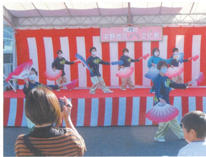
太極拳コスモスサークル