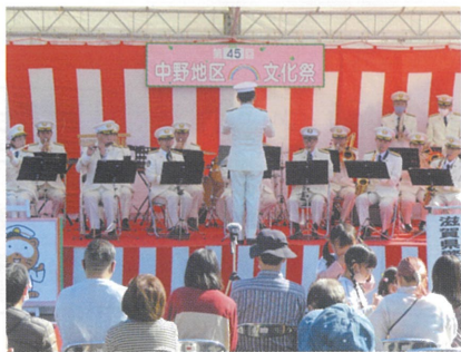
滋賀県警察音楽隊