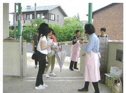
↑愛東あいあい幼稚園で、食育の日の呼びかけ