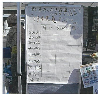
↑愛東秋まつりで野菜たっぷり減塩ぶた汁の配布とアンケート調査

講座のお申込み、お問合せは東近江市健康推進課 (TEL0748-24-5646)まで。