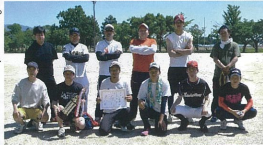
優勝された小倉町のみなさん