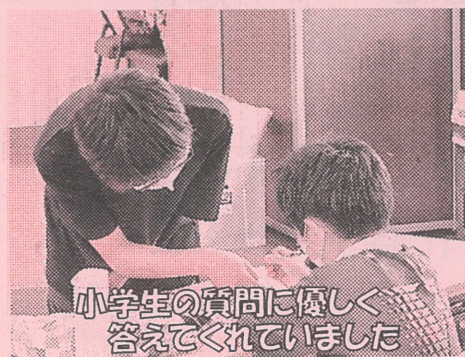
小学生の質問に優しく 答えてくれていました