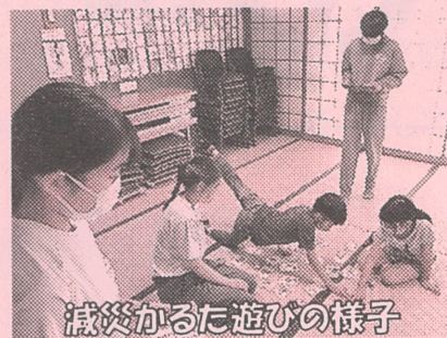
減災かるた遊びの様子

参加の子どもたちは大変礼儀正しく、船中生徒さんは一生懸命で優しい対応をいただき、笑顔あふれる1日になりました。