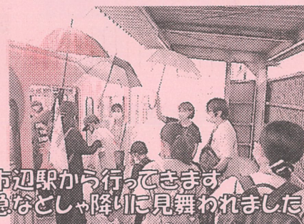
市辺駅から行ってきます 急なとしゃ降りに見舞われました