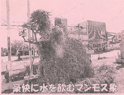
豪快に水を飲むマンモス象

まち協自然環境部が地区内に頒布されたゴーヤ苗をコミセンにも頂いて前庭に植えました。プランターから地植えに替えての挑戦でした。5月末の植え込みから見事に成長し、8月には収穫、そしてマンモス象(?)へと変身!