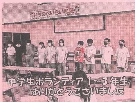
中学生ボランティア1~3年生 あいさつありがとうございました

夏休み企画に多くのお申し込みをいただき、8回予定していました内の7回を開催しました。