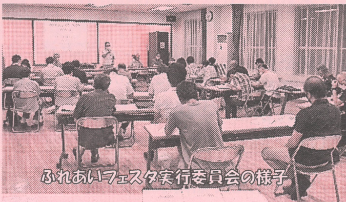
ふれあいフェスタ実行委員会の様子