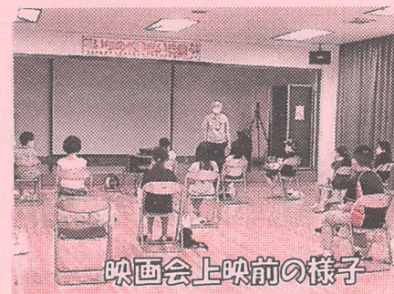
映画会上映前の様子

各日午前午後の計4回開催しました。久しぶりに友達に会う機会にもなり、嬉しそうな顔が見られました。