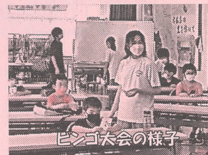
ビンゴ大会の様子