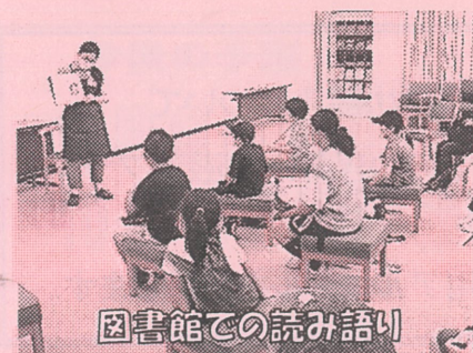
図書館での読み語り

八日市駅では鉄道博物館を見学し、帰りの切符を自分で購入し、みんな無事に帰って来られました。