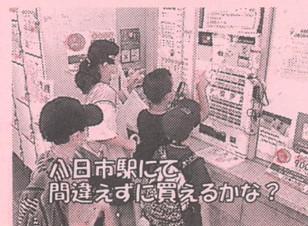
八日市駅にて 間違えずに買えるかな？

各日午前午後の計4回開催しました。久しぶりに友達に会う機会にもなり、嬉しそうな顔が見られました。